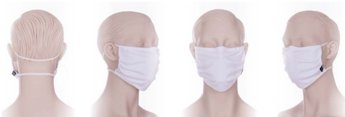
Abb.: Anlegeanleitung (Quelle: Produktinformation „Wiederverwendbarer Mund-Nasen-Schutz“ von TRIGEMA)